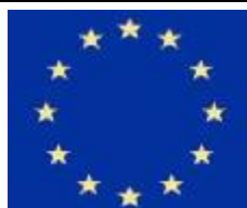
Tableau issu du site http://www.euro.gouv.fr/